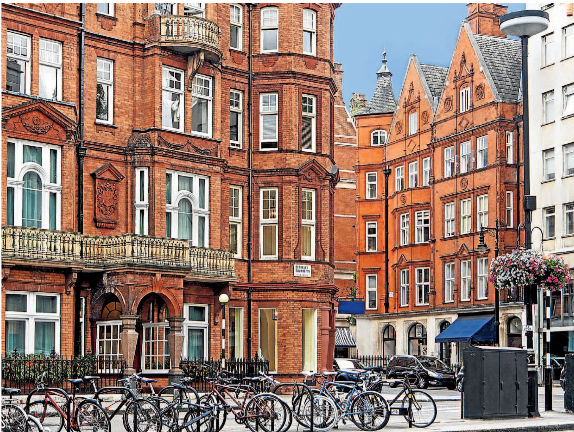
Edificios de apartamentos en el distrito londinense de Mayfair.

➤ su gran amiga Maxime Kumin, a su mentor y también poeta W.D. Snodgrass y a numerosos colegas. Recorrer las más de quinientas páginas del libro es adentrarse en el bosque de una vida que acabó pronto pero que fue vivida intensamente y encontrar en ese bosque rayos de luz que iluminan la obra de una extraordinaria poeta. La lectura paralela de los poemas a los que se refieren las cartas es doblemente interesante.